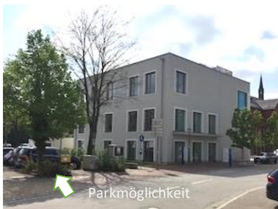
Sicht von Nürnberg/ Stuttgart

Befahren Sie die A9 Richtung Norden – am Autobahnkreuz 65 Dreieck Holledau fahren Sie auf die A93 Richtung Hof/Regensburg/Wolnzach – danach nehmen Sie die Ausfahrt 46 Bad Abbach und fahren Richtung Bad Abbach immer geradeaus – dabei wird die Römerstr. zur Kaiser-Heinrich-II.-Str. – nach einer Rechtskurve finden Sie uns auf der rechten Seite im Raiffeisenbank-Gebäude. Der Eingang befindet sich im Vorhof links.